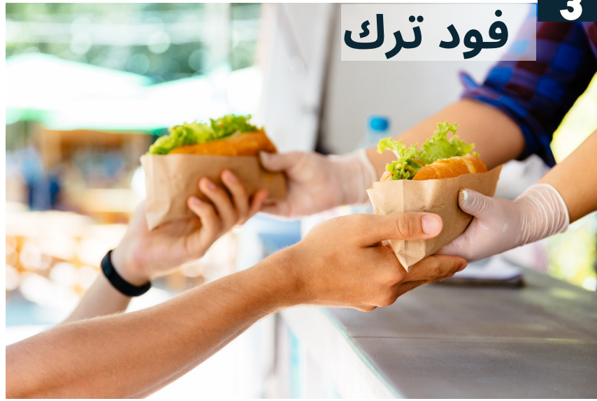
فود ترك 3