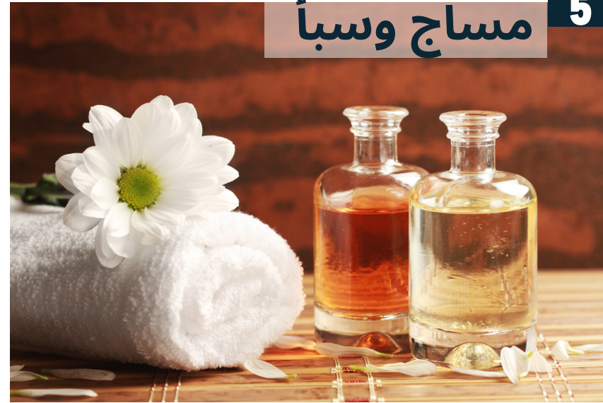
مساچ وسبأ 5