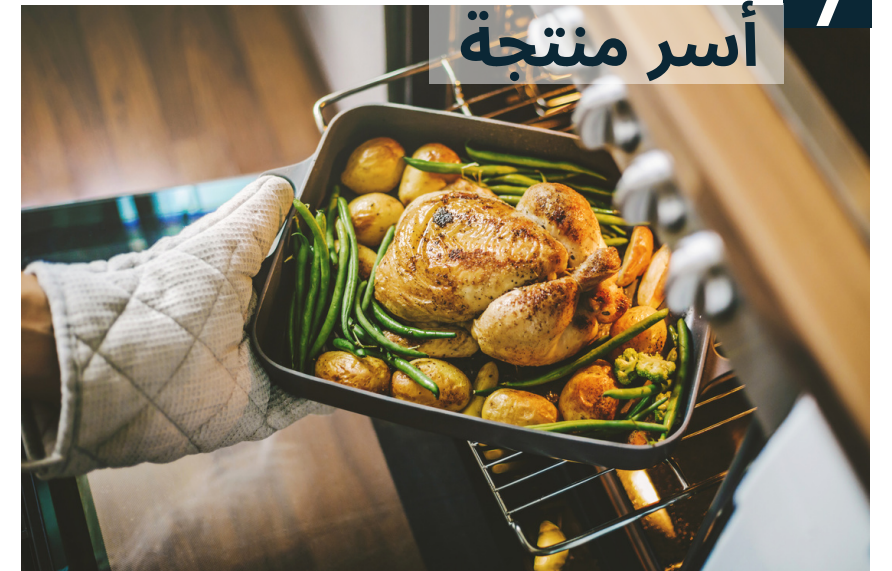
أسر منتجة 7