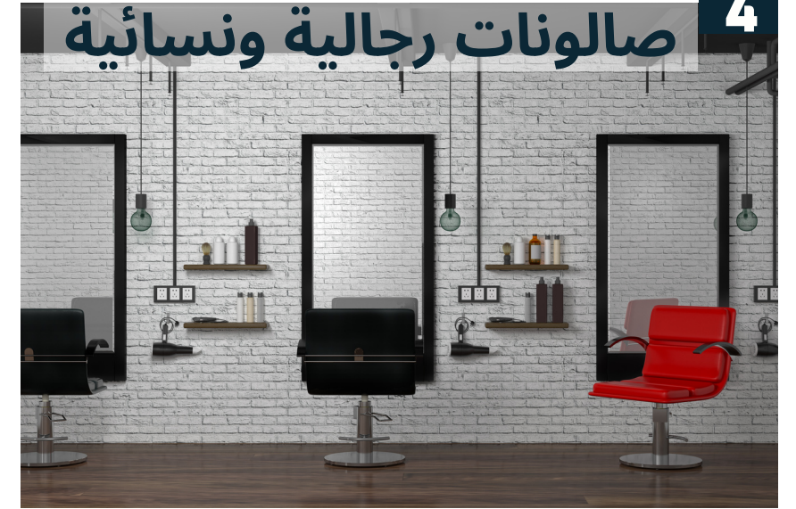
صالونات رجالية ونسائية 4