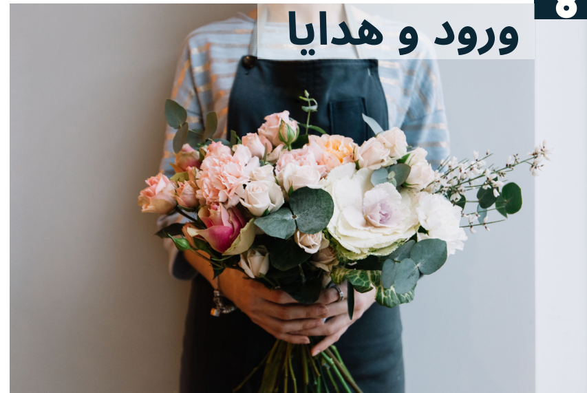
ورود و هدايا 8